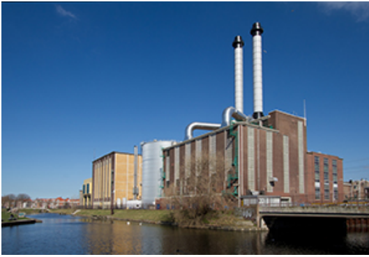
E.ON ENERGIECENTRALE, DEN HAAG