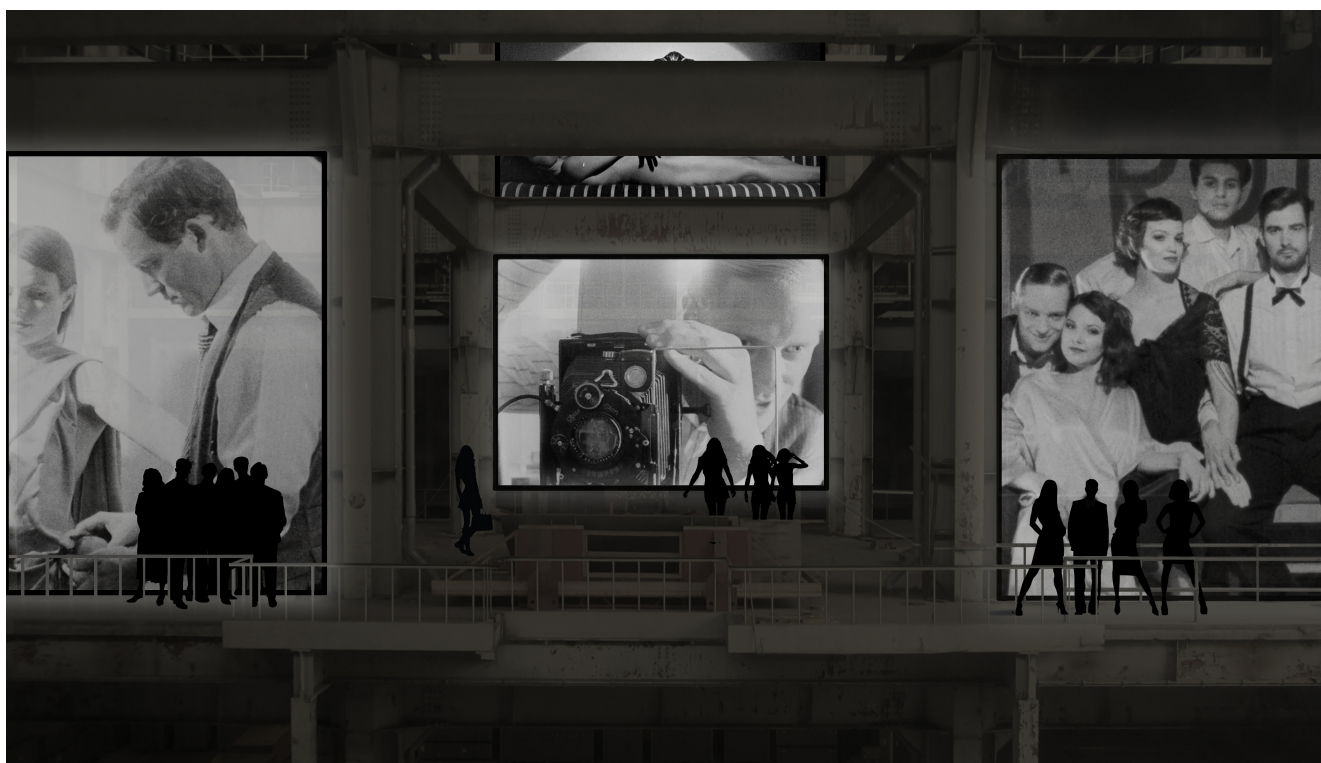
SFEERIMPRESSIE OP LOCATIE — TURBINEHAL MET FILMINSTALLATIE THE LOST OP 7 SCHERMEN (FOTOMONTAGE)

Het Volkspaleis vindt dit jaar plaats in de Turbinehal van de E.On Energiecentrale in het centrum van Den Haag. De kolossale, industriële hal met een vloeroppervlak van 2500 m 2 en een hoogte van 35 meter wordt hiermee voor het eerst toegankelijk voor een breed publiek. West toont hier de wereldpremière van het prachtige, monumentale filmproject The Lost (Die Verlorenen) van de internationaal bekende Amerikaanse kunstenaar Reynold Reynolds.