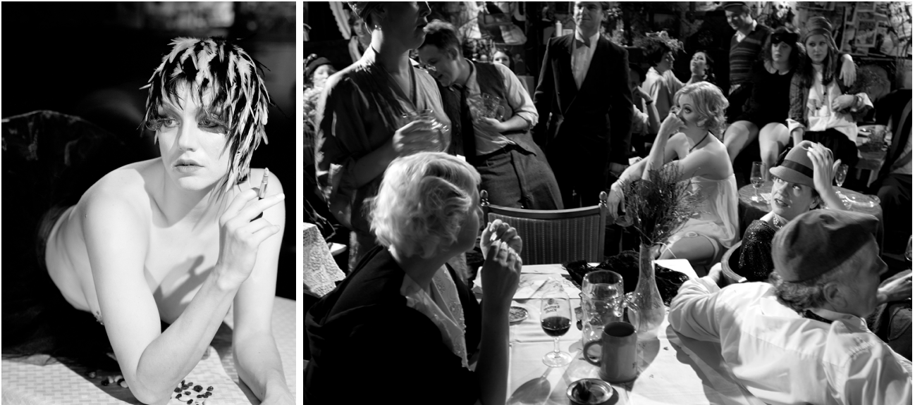
SETFOTO'S: REYNOLD REYNOLDS — ENKELE SCÉNES UIT THE LOST (DIE VERLORENEN) — GEMAAKT TUSSEN 2011 EN 2013